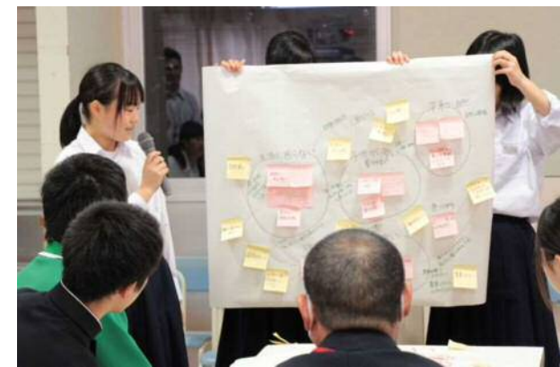
北区未来会議：南浜中