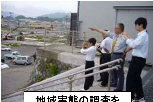
地域実態の調査を 取り入れた授業