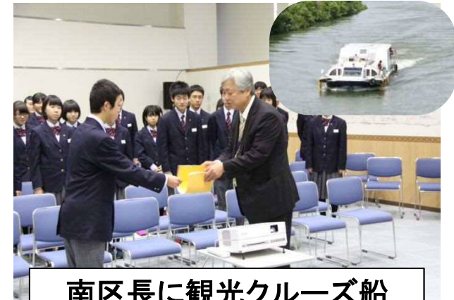
南区長に観光クルーズ船 乗船体験を提言：白南中