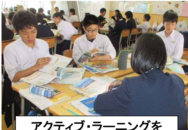
アクティブ・ラーニングを 取り入れた授業