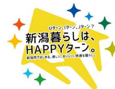
市主催移住セミナー

地域おこし協力隊を活用した情報発信や体験居住の支援により、テレワーカーの移住・定住を促進