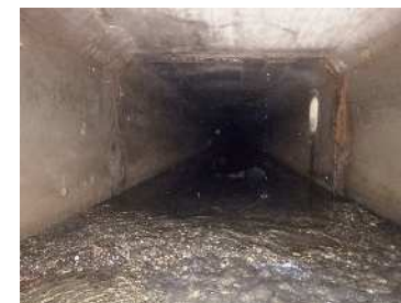
下水道施設(管路)の改築更新

主に交通量の多い幹線道路において舗装状態を把握するための路面性状調査等を実施し、その結果に基づいた補修を推進