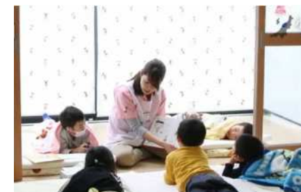
病児・病後児保育

病児・病後児保育において、新たに空き状況の見える化など利便性向上のため予約システムを導入するほか、隣接自治体と連携し利用できる施設を拡充するなど、多様なサービスを実施