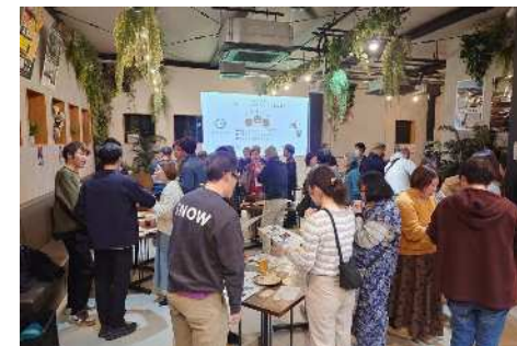
共創コミュニティ

地域おこし協力隊やクラウドファンディング型ふるさと納税等を活用して、地域で主体的に活動する人たちのコミュニティの充実や課題解決に向けた取り組みを支援