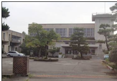
旧潟東東小学校跡地