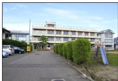
旧潟東西小学校跡地