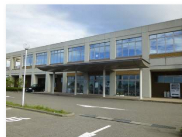
長く市民に親しまれる施設であるために