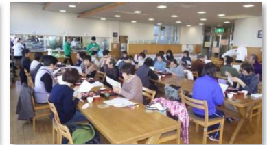
健康食を食べよう(構成団体他施設)