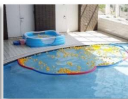
あひるプール(構成団体他施