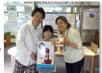
父の日ガラポン大会