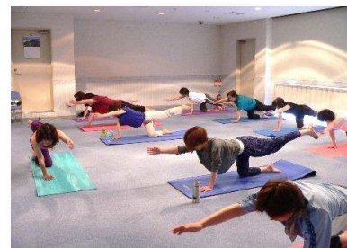
多様な健康教室の実施