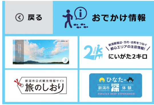
お出かけメニューへ