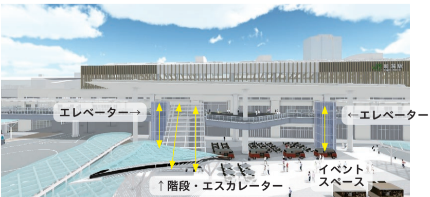
▲広場中央付近から駅舎方向を望む