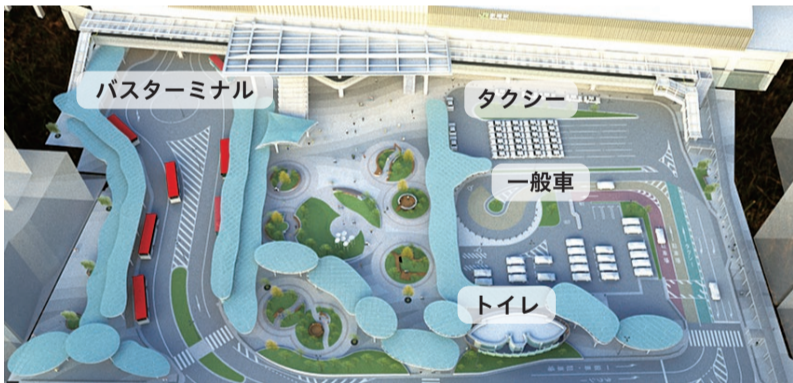
▲東大通上空から望む

令和7年度末に完成予定の万代広場は、旧広場の約2倍の面積があります。「人・交通・自然が気持ちよく循環する都市の庭」をコンセプトに、交通結節点としての機能に加え、イベントスペースや緑あふれ人々が憩い集うことができる里山をイメージした空間を整備していきます。