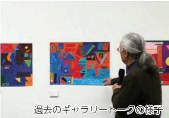
過去のギャラリートークの様子