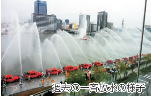
過去の一斉放水の様子