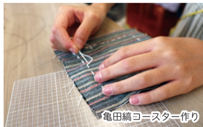
亀田縞コースター作り