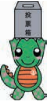
市選挙マスコット トウヒョウザウルス 「きめたらう」