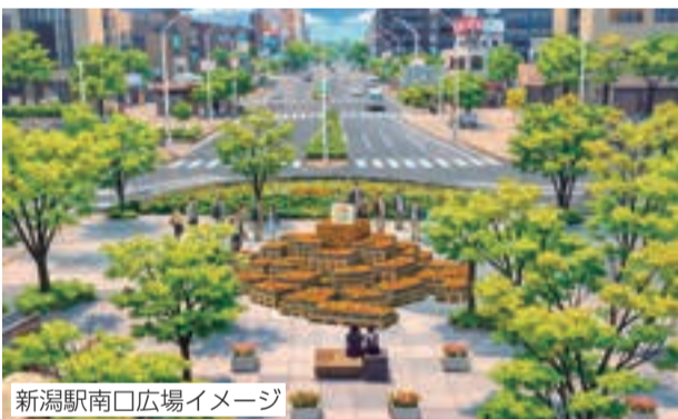
新潟駅南口広場イメージ