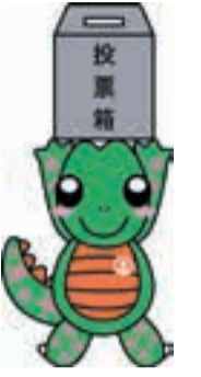
市選挙マスコット トウショウザウルス「きめたらう」