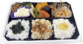
彩り野菜の6升弁当

栄養士を目指す学生が試行錯誤して考案しました。 授業で学んだことやイオンで学んだ商品づくりの知識、おいさと栄養バランス、私たちの思いが「全部盛り」なお弁当です。 2月8日(日)には、イオンスタイル新潟亀田インターで販売イベントを行います。ぜひ来てください。