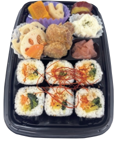
野菜が摂れるキンパ風弁当