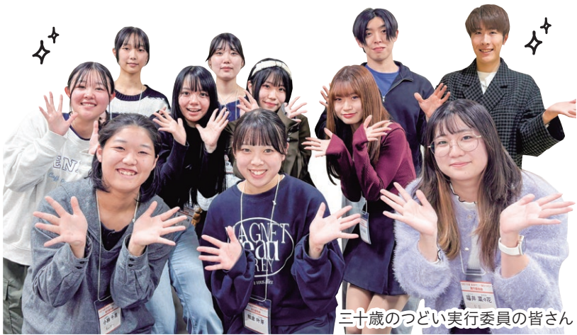
三十歳のつどい実行委員の皆さん