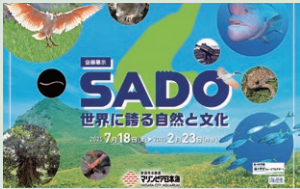
▲企画展「SADO 世界に誇る自然と文化」