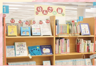
▲ほんぽーと中央図書館のりんごの棚

スウェーデンの図書館から始まった、全てのこどもに読書の喜びを体験してもらうためのコーナーです。大きい文字で書かれた物語や点字が付いた絵本、布の絵本などがあり、誰もが本を楽しむことができます。