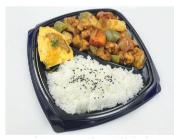
酢鶏でいりどり中華弁当