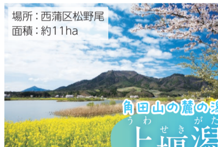
場所：西蒲区松野尾 面積：約11ha

中央区の市街地に隣接する潟。鳥類は180種以上確認され、冬には約4,000羽を超えるハクチョウが飛来します。潟マルシェなどのイベントや、潟内の栄養循環を良くするために「空心病」を栽培するなど、市民団体により、さまざまな活動が行われています。