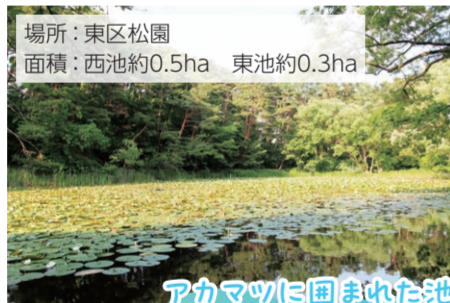
場所：東区松園 面積：西池約0.5ha 東池約0.3ha

一度干上がり陸化しましたが、1993年から数年かけて復元した潟です。四季折々の花などが楽しめ、わらアートまつりなどのさまざまなイベントが行われる上堰潟公園内にあります。