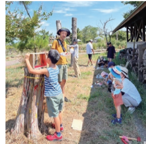
▲枯れ木に色付けしたり、流木をくくり付けたりしながら、親子でアート制作を楽しむ様子