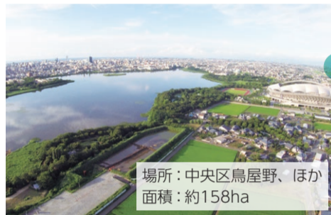
場所：中央区鳥屋野、ほか 面積：約158ha