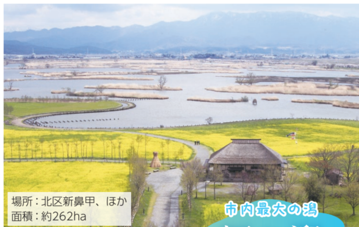
場所：北区新鼻甲、ほか 面積：約262ha