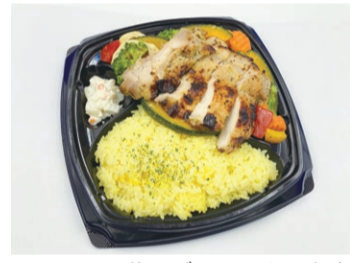
カラフル野菜のグリルチキン弁当

市民の皆さんに栄養バランスの整った食事や食生活の改善などを再認識してもらえよう、新潟県立大学健康栄養学科の3年生がイオンリテール(株)と連携して開発した弁当を販売しています。購入後、アンケートに回答した人の中から抽選で県産米などをプレゼントします。※詳しくは新潟市ホームページに掲載