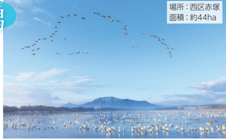
場所：西区赤塚 面積：約44ha