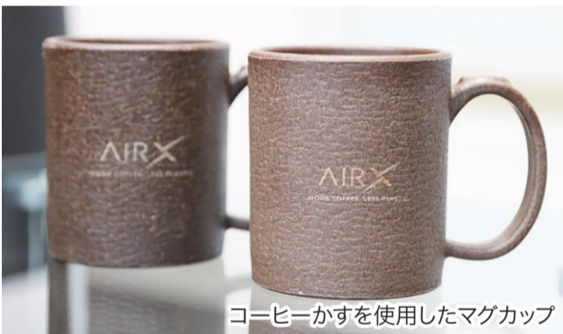
コーヒーかすを使用したマグカップ

新潟市は、市内での起業・開業や、新製品・新事業の開発に向けた取り組みを支援しています。今号では、新潟市の中小企業支援について取り上げます。