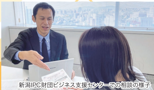
新潟IPC財団ビジネス支援センターでの相談の様子