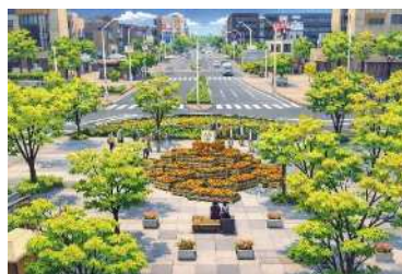
フラワーモニュメント