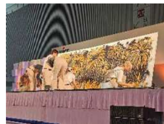
ライブペインティングパフォーマンス