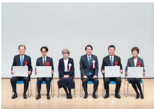
▲昨年の様子（健康経営優秀賞）