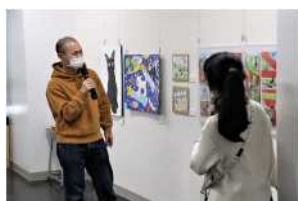
アーティストトーク