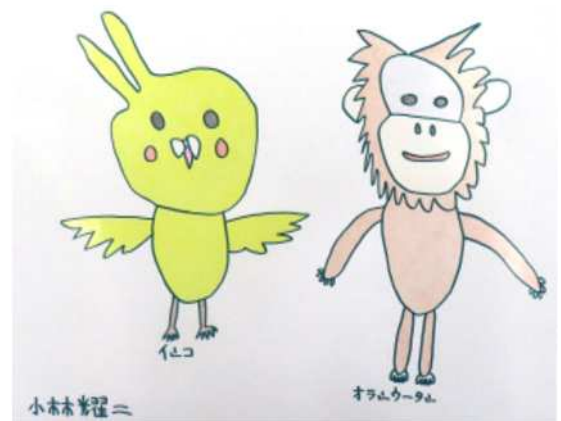
小林 耀二《インコとオランウータン》