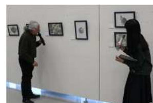
ギャラリートーク

※取材いただく際は、事前にご連絡ください。監修者および出展アーティストへの取材対応が可能な場合があります。