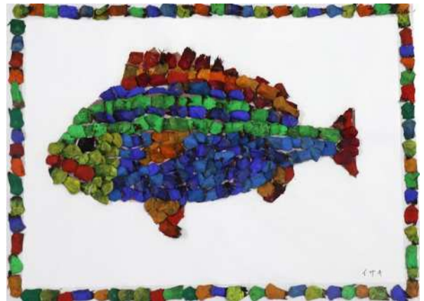
たけし《イサキの魚拓（松ぼっくり製）》