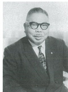
写真 初代東映社長大川博氏 年不詳