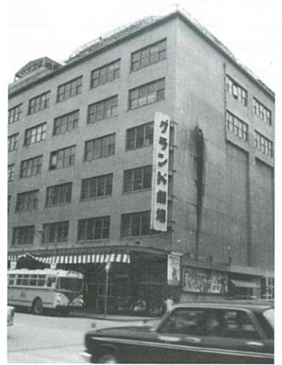
写真 グランド劇場 年不詳

映画最盛期の人気映画ベストテンと世相、市街の映画館の盛衰、新潟ゆかりの映画人のほか、巡業に使われた映写機や70年以上前の貴重な新潟ロケ映画などから、映画が新潟の人々を魅了した時代を振り返ります。