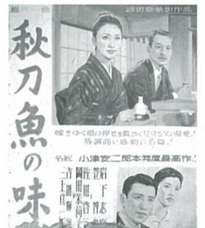
映画看板「秋刀魚の味」 昭和37(1962)年 当館蔵 ©1962松竹株式会社