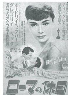
映画ポスター「ローマの休日」 昭和29(1954)年 個人蔵

12/6 ローマの休日(118分) 12/13 第三の男(105分) 12/20 愛妻物語(96分) 12/27 市民ケーン(119分) 1/17 シェーン(118分) 1/24 麦秋(124分)