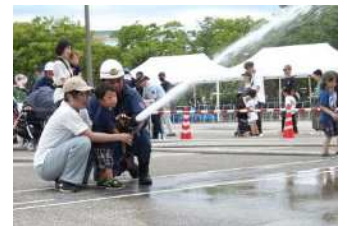
ちびっこ消防団（放水体験）