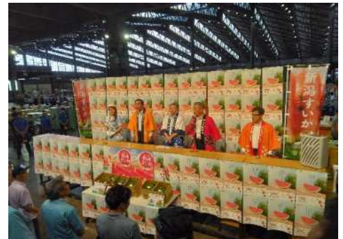
すいかトップセールスの様子