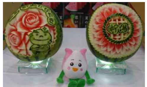
トップセールス時のすいかカービング