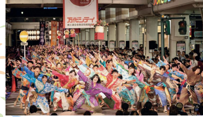
万代シテイでは会場を盛り上げる総踊りを開催!