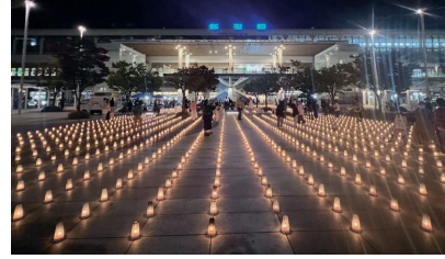
新潟駅では幻想的なキャンドルガーデンが広がります