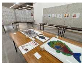
アピタパワー新潟亀田店