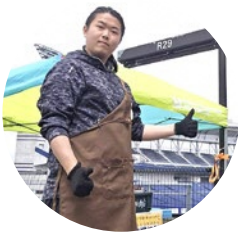
株式会社パッチワーク AKIHA、 秋葉区移住コンシェルジュ

A2) 「今を楽しむ、過去を懐かしむ、未来を描く」ことを忘れないでほしいです。二十歳になった皆様は、 恐らく色々なことを学んで、体験してこられたと思います。それらは今後皆さんが経験するすべてに比 べれば、「なんだ、小さなことだったな」と思うものかもしれません。実際、いつだって「今」が最も重要 です。でも、だからこそたまには過去を思い出してほしいです。学校などで関わった人々や、かつて好き だったこと・ものなど、なんてことない過去の思い出が、ふとした拍子に自分を支えてくれます。そうし て支えられた今は、またいつかの未来を支えていくのです。支えられる未来の自分は、きっとつらいこ とも苦しいことも乗り越えられる最高の自分になっているはず!皆様の歩まれた「これまで」が今をつく り、その軌跡が輝かしい「これから」につながりますように、皆様のご活躍を心から願っております!