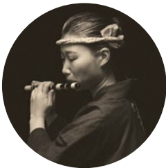
農家、秋葉区移住コンシェルジュ

私が20歳のこの日、成人の言葉で話した今もずっと大切にしている言葉があります。「物質主義に溺 れることなく、心身ともに健康で気骨と主体性の持ち主たれ。」自分らしく、愉しく生きてください。皆さ んの未来が、実り多きものになることを願っています。