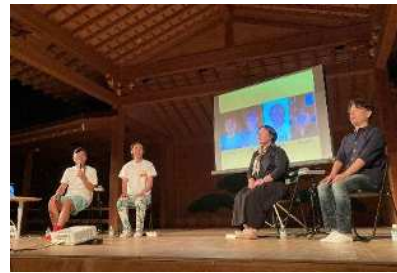
昨年度の開催状況

※リノベーションまちづくり：遊休空間等の既存資源を活用し、補助金に依存せずそのまちならではの事業（コンテンツ）創出を連鎖させ、シビックプライドの醸成やエリアの価値向上及び複合的な地域課題の解決を図る、民間主導の公民連携まちづくりの新たな取り組みです。