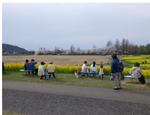
「上堰潟公園」にて撮影