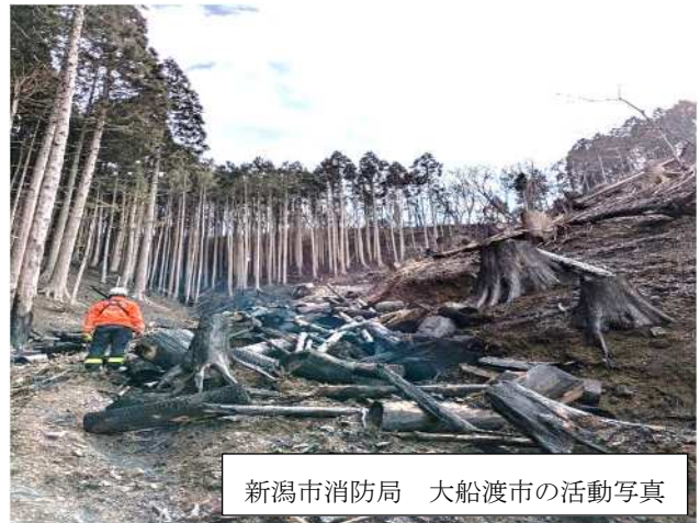
新潟市消防局 大船渡市の活動写真

※申し込み 取材を希望する場合は、 3月21日(金)午後4時まで に別紙によりFAXで連絡をお願いします。