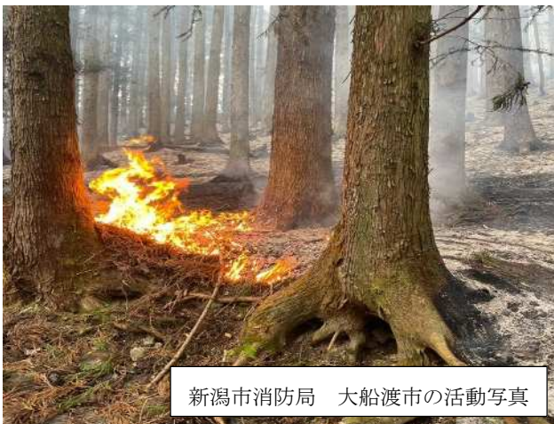
新潟市消防局 大船渡市の活動写真