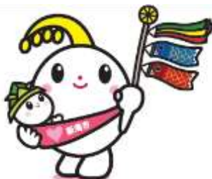
新潟市子育て応援キャラクター ほのわちゃん

https://www.city.niigata.lg.jp/kosodate/ninshin/info/kodomo_jourei.html