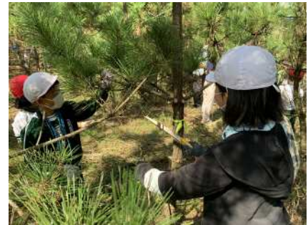
▲枝切作業イメージ

中央区汐見台周辺の海岸林は、林帯幅が他のエリアに比べて狭く、防風・防砂に対して十分な機能を満たすことができないことから、平成25年から区民協働によるクロマツ植樹を実施することで、住環境の改善を図っており、令和3年度で計画エリアの植樹を完了しました。