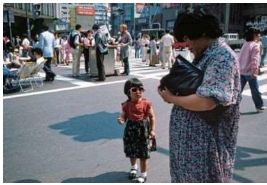
牛腸茂雄《見慣れた街の中で19》1978-80年（2004年プリント） 新潟市美術館蔵