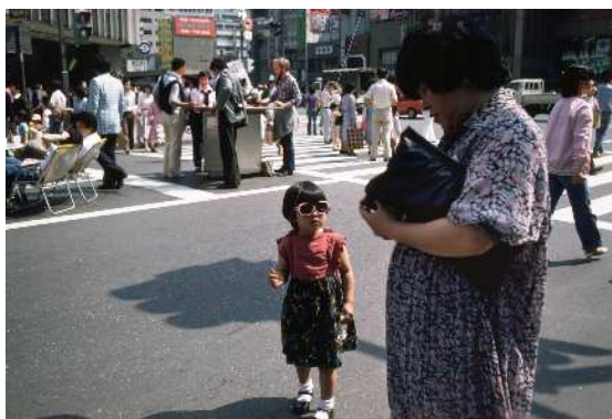
⑤牛腸茂雄《見慣れた街の中で 19》1978-80年 (2004年プリント) 新潟市美術館蔵