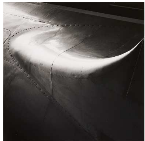
④大辻清司《航空機》1957年(1980年代プリント) 渋谷区立松濤美術館蔵