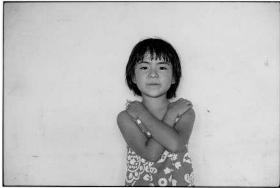
①牛腸茂雄《SELF AND OTHERS 42》1977年 (2023年プリント) 個人蔵