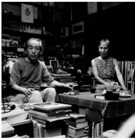
大辻清司《瀧口修造夫妻、書齋にて》1975年（2003年プリント） 富山県美術館蔵