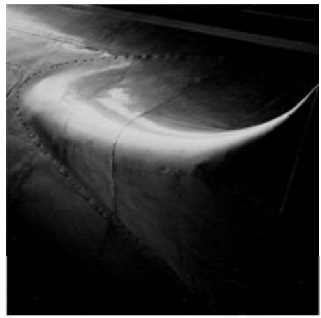
大辻清司《航空機》1957年（1980年代プリント） 渋谷区立松濤美術館蔵