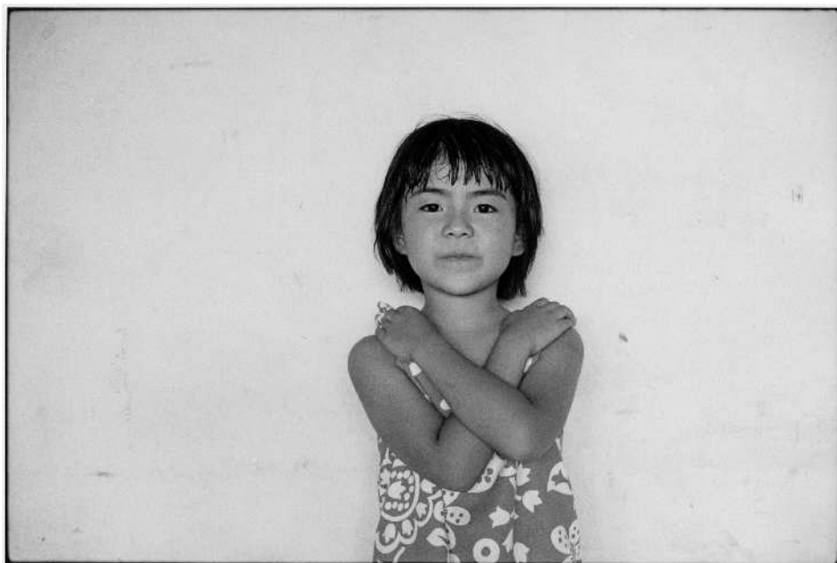
牛腸茂雄《SELF AND OTHERS 42》1977年（2023年プリント） 個人蔵