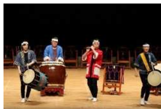
1.越王太鼓保存会×とよさか福祉会 クローバー