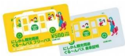
フリーパス（左）と乗車証明（右）