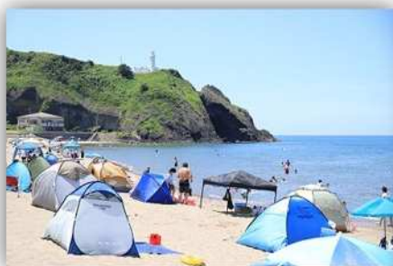
夏の角田浜海水浴場

●詳しくは別添チラシ及びホームページ： https://www.niigatawestcoast.jp/bus