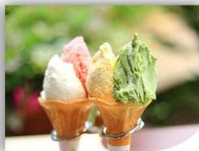
特典一例：ジェラートをシングル からダブルにアップグレード