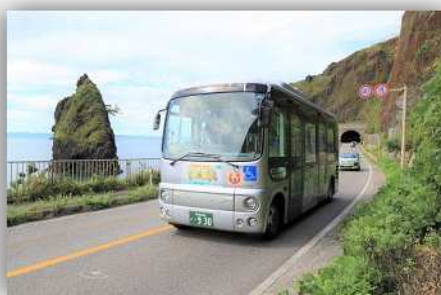
越後七浦シーサイドライン 「立岩」付近を走行するバス