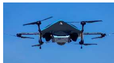
実証実験に使用する 物流専用ドローン “AirTruck”

3. 場所 離陸：新潟ふるさと村第2駐車場 着陸：ピア Bandai 駐車場 ※詳しい位置は裏面の位置図をご確認ください