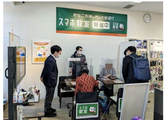
ソフトバンク古町での試験実施の様子(11月)