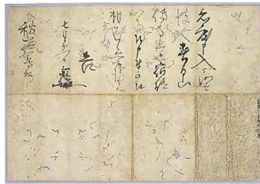
直江兼統書状 年代未詳