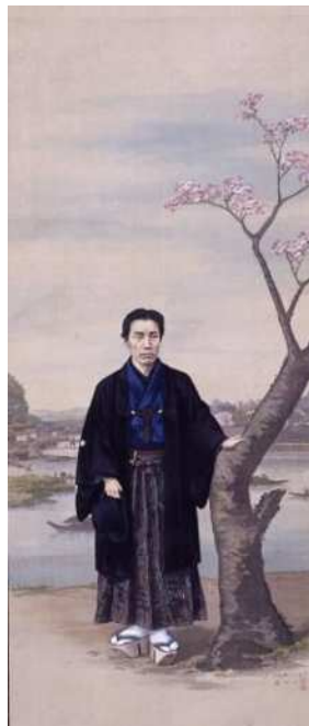
五姓田芳柳筆 年代不詳 八木朋直肖像 部分 (隅田川・向島の桜)