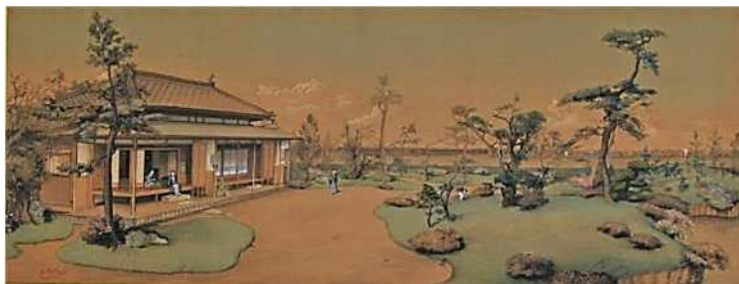
渡辺幽香筆 八木家別邸(流作場) 年代不詳