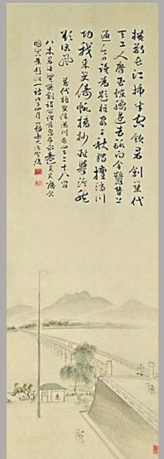
大須賀瓊筆 万代橋真景 明治 21(1888)年