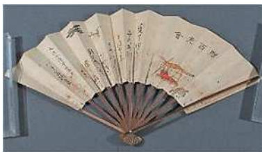
八木柳雪(朋直)筆 扇面 贈百老会 大正 9(1920)年