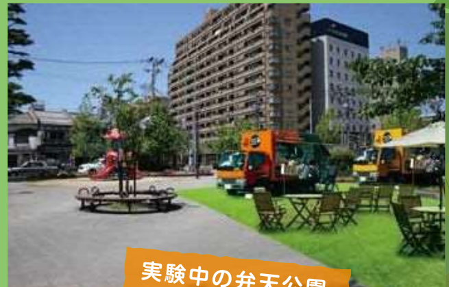
実験中の弁天公園 (イメージ)