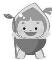
新潟市下水道キャラクター 「水玉ぼうし」