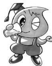
新潟市水道局キャラクター 「水太郎」