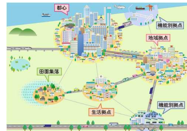
図 拠点とネットワークによる都市構造のイメージ