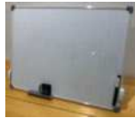
ミニホワイトボード (60×45cm) /無料(1台)