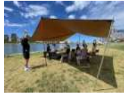
HDタープ レクタL (¥2,200/12名)