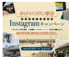
Instagram キャンペーンビジュアル

※当選発表は、事務局から当選者の皆さま宛に、Instagram のダイレクトメッセージにてご連絡させていただきます。