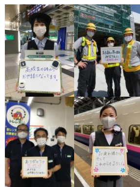
ありがとうメッセージ 駅構内掲出イメージ