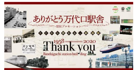
メインビジュアル