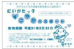
【にいがたっ子すこやかパスポート】

「にいがたっ子すこやかパスポート」など圏域内市町村が発行する子育て支援パスポートについて、それぞれの協賛店舗で相互に特典が受けられるようする。平成31年4月から聖籠町、田上町と連携開始。