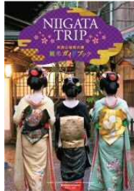
【広域観光ガイドブック】

圏域内の魅力的な観光資源をつなぐ 周遊ルート を掲載した ガイドブック を多言語(日本語・英語・中国語(簡体字/繁体字)・韓国語)で作成し、観光プロモーションに活用。