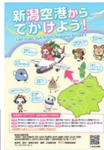
【新潟空港利用活性化ノベルティ】

新潟空港の利用活性化を図るため、連携市町村や関係機関と連携し、アウトバウンドも含めた各種空港利用促進に関連するイベントや事業情報の共有、情報発信、ノベルティ配布を実施。