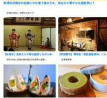
【広域観光ホームページ】