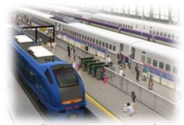
【新幹線在来線同一ホーム乗換イメージ】

圏域の玄関口として、在来線の高架化や新幹線・在来線同一ホームによる乗り換えの利便性向上、また駅前広場や高架下交通広場の整備により駅南北の連続性を高め、圏域内外へのアクセス拠点としての機能を強化。