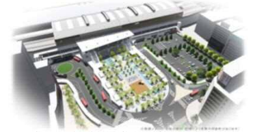
※整備イメージ：今後の検討・協議により変更の可能性があります 【新潟駅前広場(万代広場)整備イメージ】