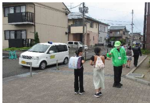
青色回転灯装備車による防犯パトロール