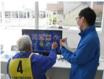
高齢者体験型交通安全教室