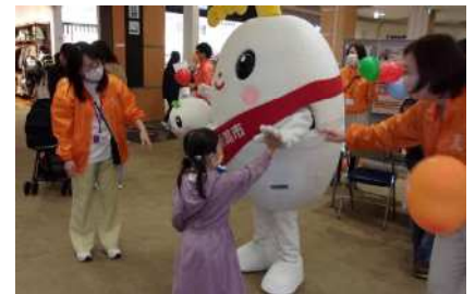
商業施設でのイベントの様子