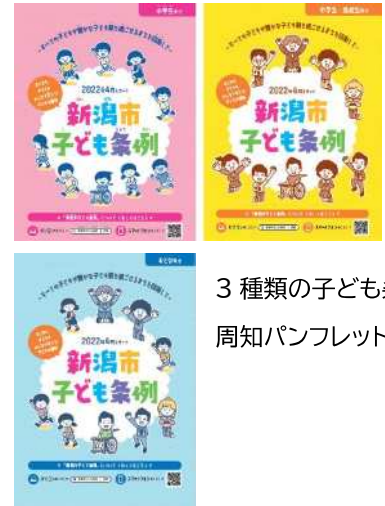
3種類の子ども条例周知パンフレット