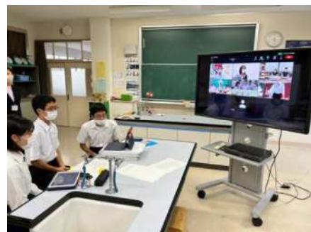
上：進行役を務める生徒（鳥屋野中）