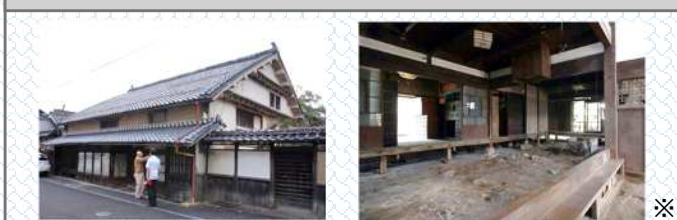
【活用前】空き家など低未利用の歴史的建築物