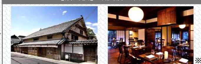
【活用後】飲食店へ転用