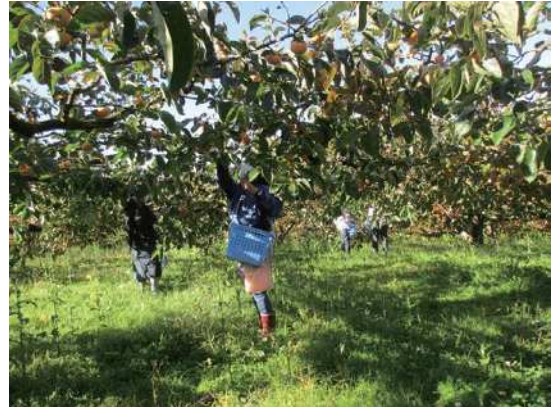
「越王おけさ柿」の収穫の様子