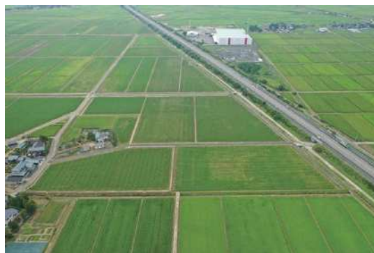
ほ場整備された田園風景