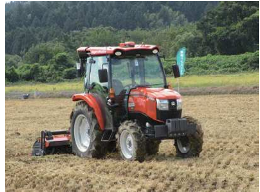
自動走行トラクター