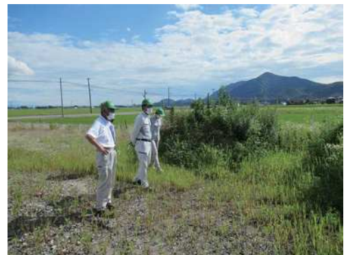
農地パトロールの様子