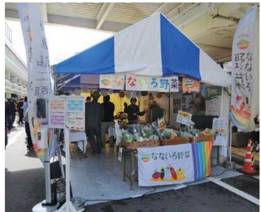
にいがた2km食花マルシェでの「にしかん なないろ野菜」のブース