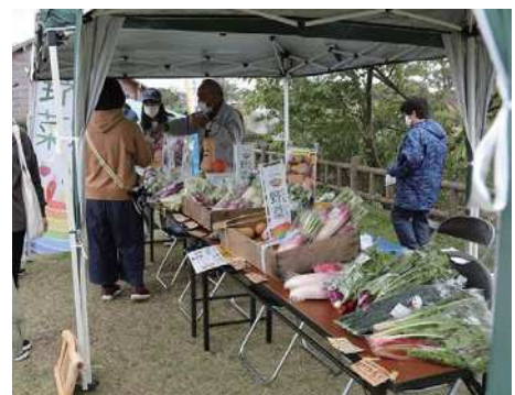
なないろ野菜販売促進イベントの様子