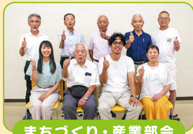
まちづくり・産業部会