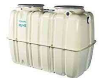
■写真「合併処理浄化槽」

注：「黄色」は新制度で新たに補助対象となる工事 ※「浄化槽移行区域」における新築設置工事のみを対象