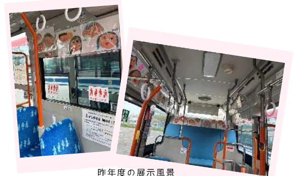
昨年度の展示風景