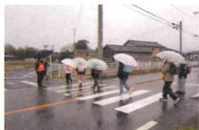
セーフティスタッフ