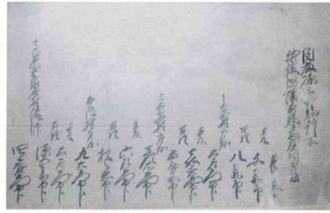
享保十六年の「村絵図」に記された庄屋と村役人名、抜粋(潟東民俗資料館所蔵)

—もっと知りたい潟東の歴史・人・風土— 第二十四回 八カ村が幕府に訴えた水争いとその結末 福田則男